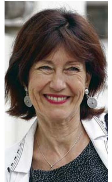
Laurette Onkelinx PS